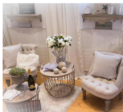
Eine Boutique zum Wohlfühlen

Design soll aber auch inspirieren: «Mit den über 20 verschiedenen Kalkfarben und weiteren diversen Artikeln möchte ich auch kreativen Menschen die Möglichkeit geben, ihre Ideen in die Tat umzusetzen», sagt die kreative Mutter. Ebenfalls in die Boutique integriert ist das Atelier *LULU Art von Andrea Schnellmann. Das Label steht für: mit Liebe genähte Einzelstücke, handgemacht, tolle und trendige Artikel, individuell gestaltet.