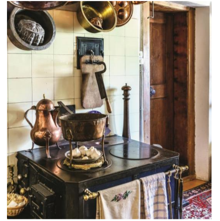
Alte Küche eines Landvogthauses.

ren lassen. Dazu bietet das Hotel Restaurant Rigibahn den zahlreichen Besuchern eine Verpflegungs- und Übernachtungsmöglichkeit. Um die Jahrhundertwende findet bereits ein erster Umbau statt: Das Hotel wird um ein weiteres, ebenfalls als Sichtbauwerk gestaltetes Vollgeschoss ergänzt. Um 1908 wird der Name von Hotel Pension Rigibahn auf Hotel Terminus geändert. 2015: Mit dem Architekten Vincenz Erni werden grosse Umbauten und Renovationen durchgeführt: Nebst dem Einbau einer neuen, ökologischen Pelletheizung wird der 1930 eingebaute Schindlerlift ersetzt. Noch heute steht das Hotel Terrasse, das sogar ins Wasser hinaus gebaut ist, für traumhafte Sonnenuntergänge und die Ruhe des Sees.