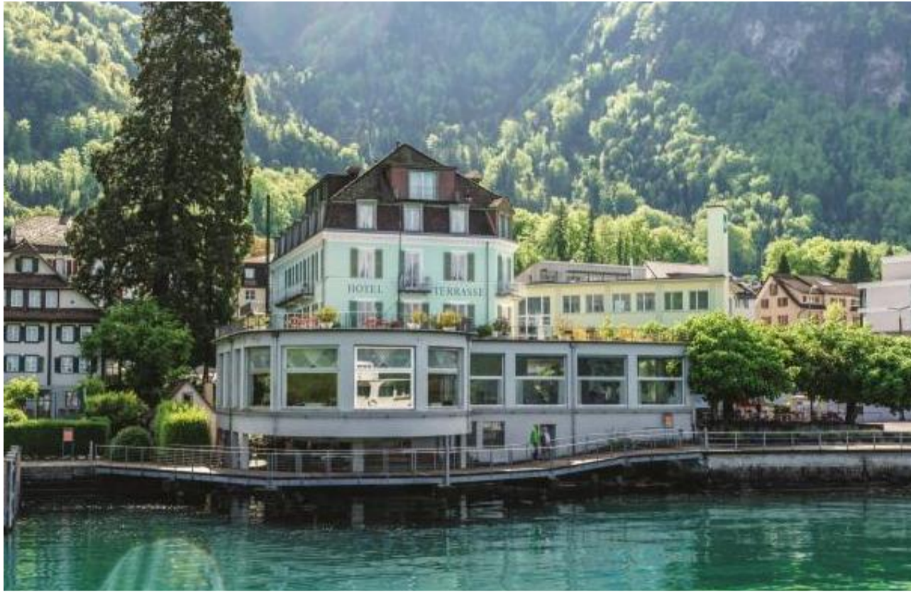
Das heutige Hotel Terrasse am See wurde von der Rigibahn Gesellschaft erbaut und 1873 eröffnet.

Die fünf saisonal aufgeteilten Routen führen von einem Swiss Histo-